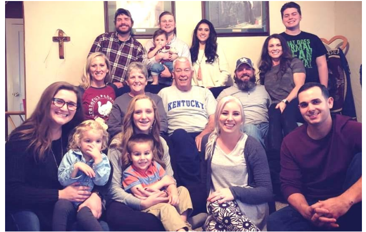
Más abuelos rodeados de sus nietos

“Una vez que se le preguntó a un hombre: "¿Qué ganaste rezando regularmente a Dios?" El hombre respondió: "Nada... pero déjame decirte lo que perdí: Ira, ego, avaricia, depresión, inseguridad y miedo a la muerte". A veces, la respuesta a nuestras oraciones no es ganar, sino perder, que es la ganancia".